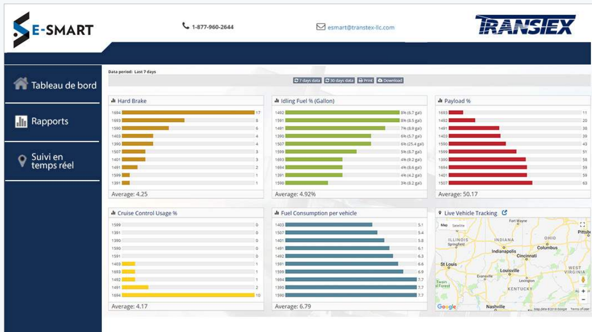
Tableau de bord intuitif montrant des indicateurs clés du rendement comme les freinages brusques, le pourcentage de consommation de carburant à l'arrêt, le pourcentage de charge transportée, le pourcentage d'utilisation du régulateur de vitesse, la consommation de carburant et le suivi du véhicule en temps réel.